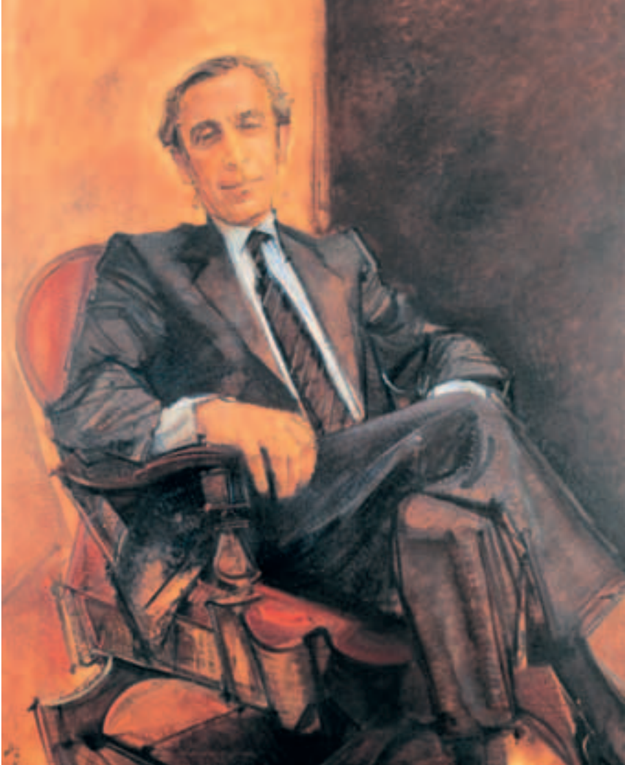
Obra de Álvaro Delgado Ramos