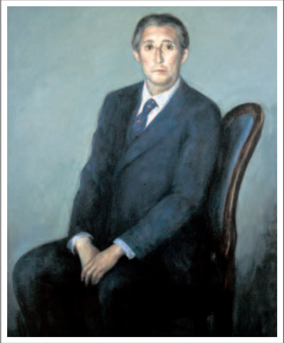
Obra de Pedro Bueno