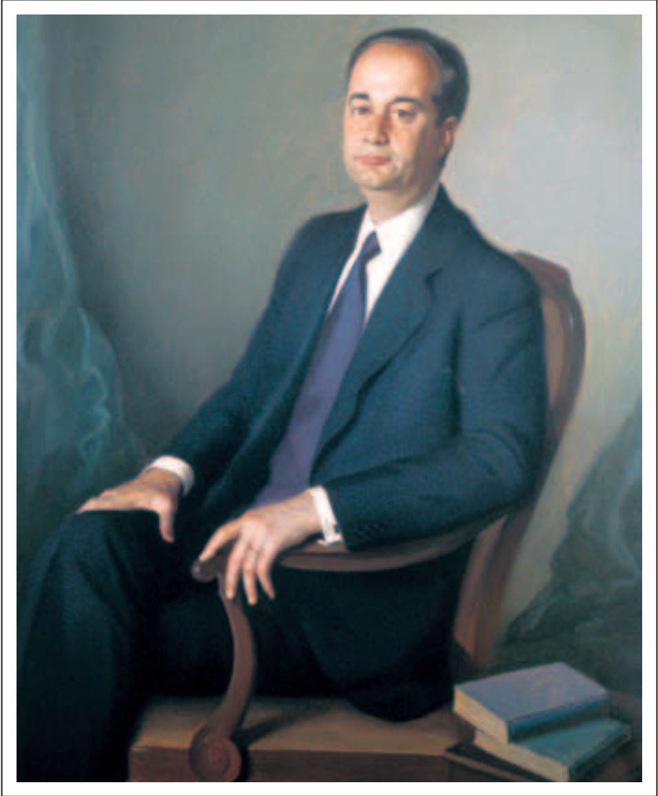
Obra de Enrique Segura Iglesias