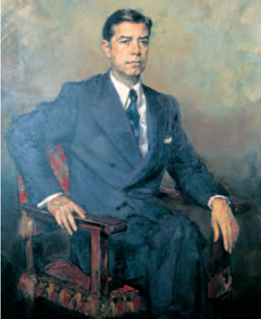
Obra de Ricardo Macarrón Jaime