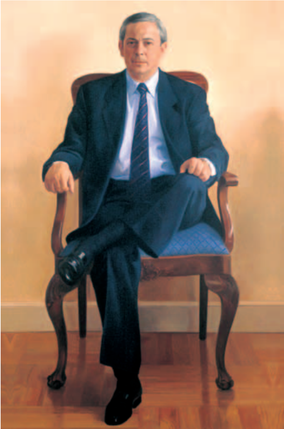
Obra de Juan Moreno