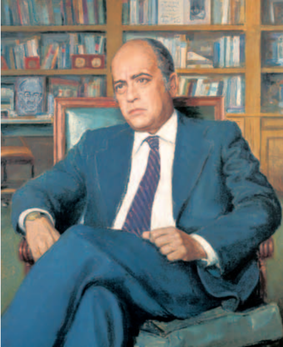
Obra de Lucio Muñoz Martínez