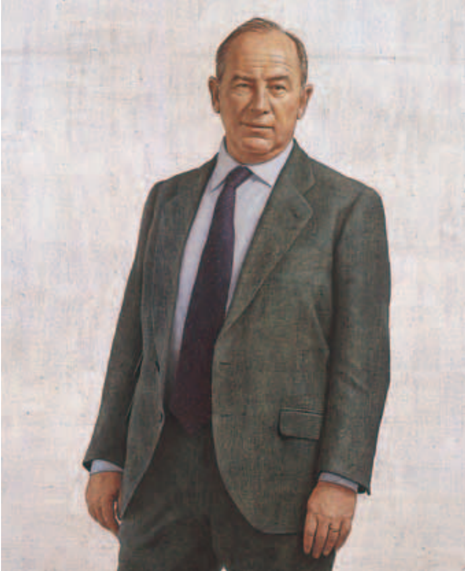
Obra de Hernán Cortés Moreno