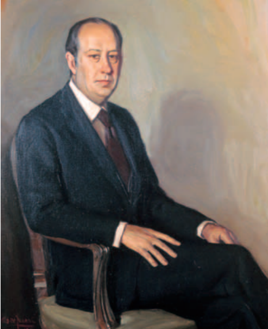
Obra de Francisco de Juanas