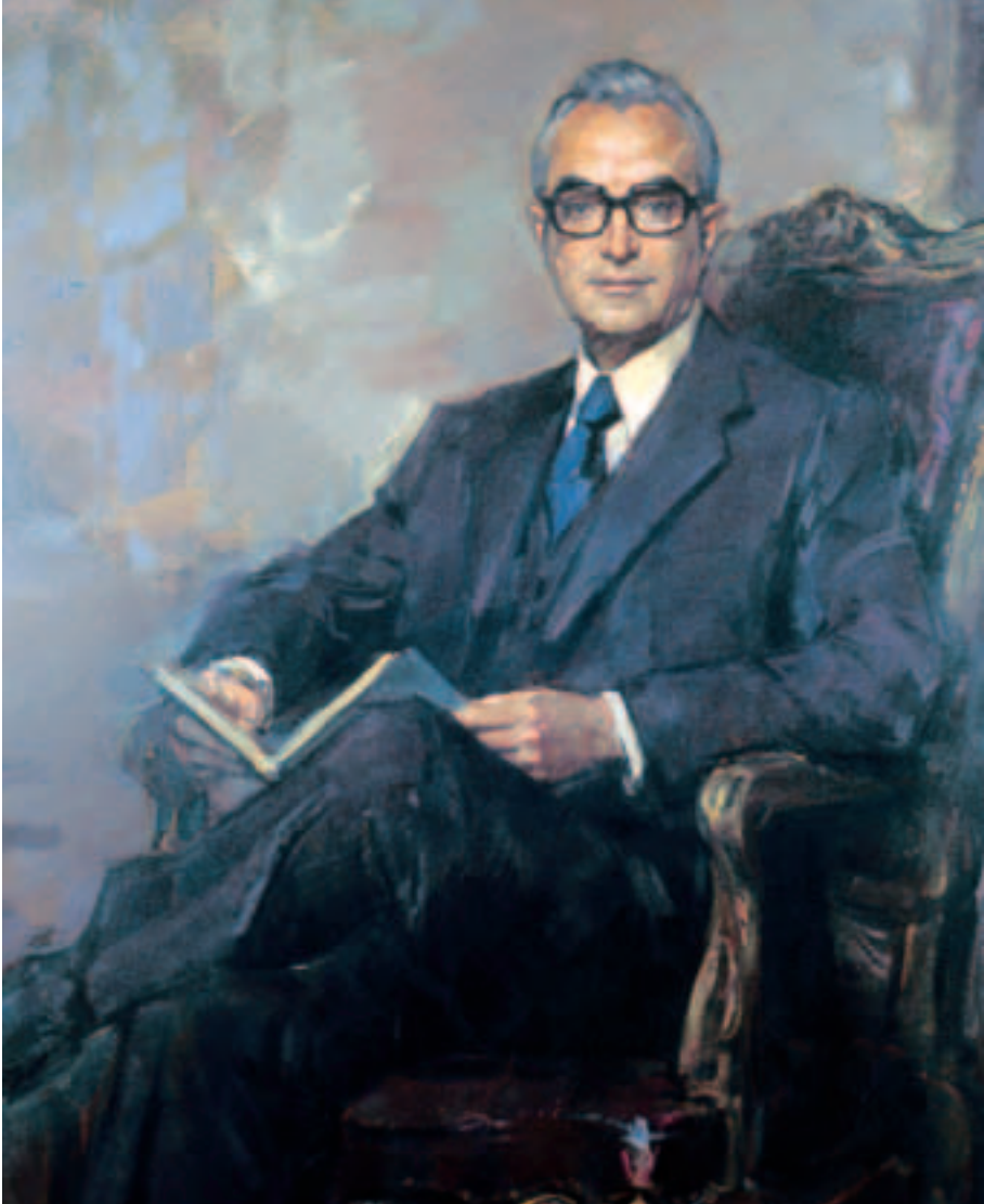
Obra de Ricardo Macarrón Jaime