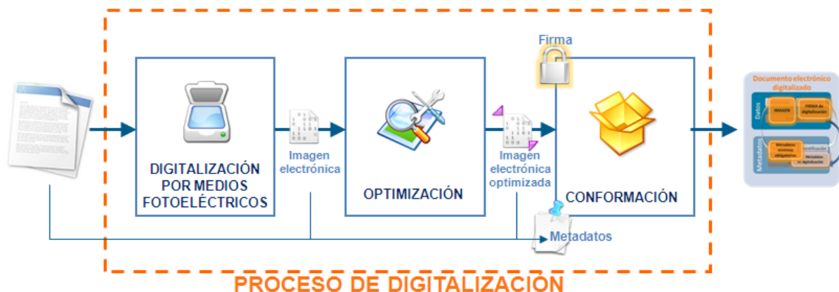
Figura 2. Tareas en el proceso de digitalización.